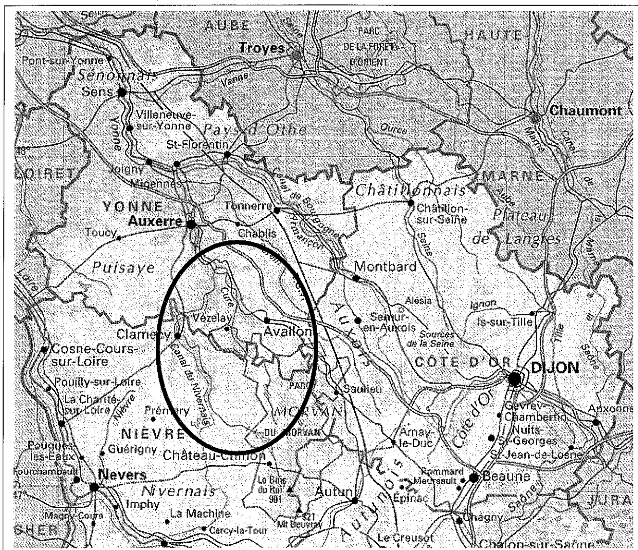
Figure 2 : Localisation de la zone d'étude

LA CURE connut, par le passé, une importante activité meunière, comme l'attestent les nombreux moulins présents le long de la vallée, aujourd'hui pour la plupart hors état de marche. La rivière fut par ailleurs longtemps utilisée pour le flottage « à bûches perdues » des bois du MORVAN, assurant l'alimentation de PARIS en bois de chauffage. Cette activité s'est poursuivie depuis sensiblement la seconde moitié du 16 ème siècle jusqu'au milieu des années 1920 (période à laquelle le gaz de ville s'est généralisé dans la capitale, supplantant ainsi progressivement le bois).